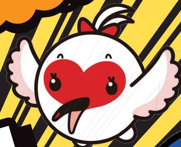
新潟県宣伝課長 「トッキッキ」