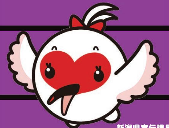
新潟県宣伝課長 「トッキッキ」 ©新潟県